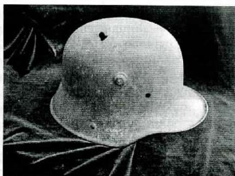
Шлем-каска. Германия 1940-е гг.

армии), патрон к противотанковому ружью, пряжка с фрагментами кожаного ремня «GOTT MIT UNS», шлем-каска, коробка для пулеметной ленты – магазин пулемета MG-42, лента пулеметная, лента пулеметная с трассирующими зарядами, пули для пистолета, обоймы винтовочные с патронами, гильза с пулей (без пороха) для винтовки, граната ручная, снаряд, мина осколочно-фугасная для 82 мм миномета, граната ручная, медаль, знак военный наградной и другие предметы. Трофейное вооружение разместили в одном из залов музея, а также во дворе.