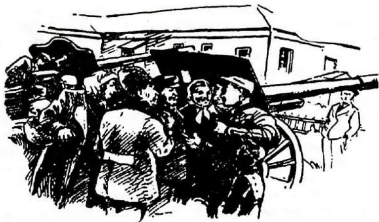
«У трофейных орудий на выставке в музее». Зарисовка И. Шульгина. Омская правда. 21 мая 1944 г.

ты уложили в могилы миллионы фашистского зверья. На открываемой выставке представлены все виды стрелкового и минометного вооружения Красной Армии. В ближайшее время поступят образцы советской артиллерии и танков. Военная техника СССР, ненавистная врагам, будет с любовью осматриваться советскими людьми. Выставка в целом даст яркое представление о стрелковом вооружении современных армий. Наличие исторического отдела с образцами оружия XIII – XIX вв. даст интересный материал для сравнения развития военной техники» 47 .