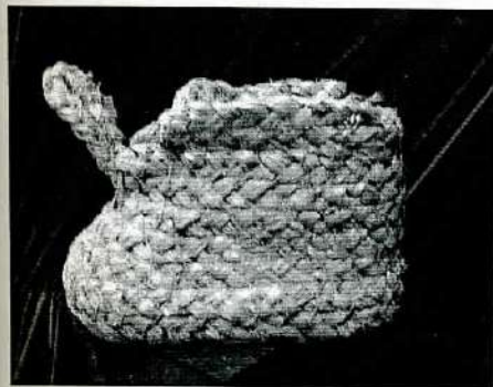
Калоша из соломы (из обмундирования нацистской армии). 1940-е гг.

В 1942 г. демонстрировались трофеи, привезенные омской делегацией с Ленинградского фронта: калоша из соломы (из обмундирования нацистской