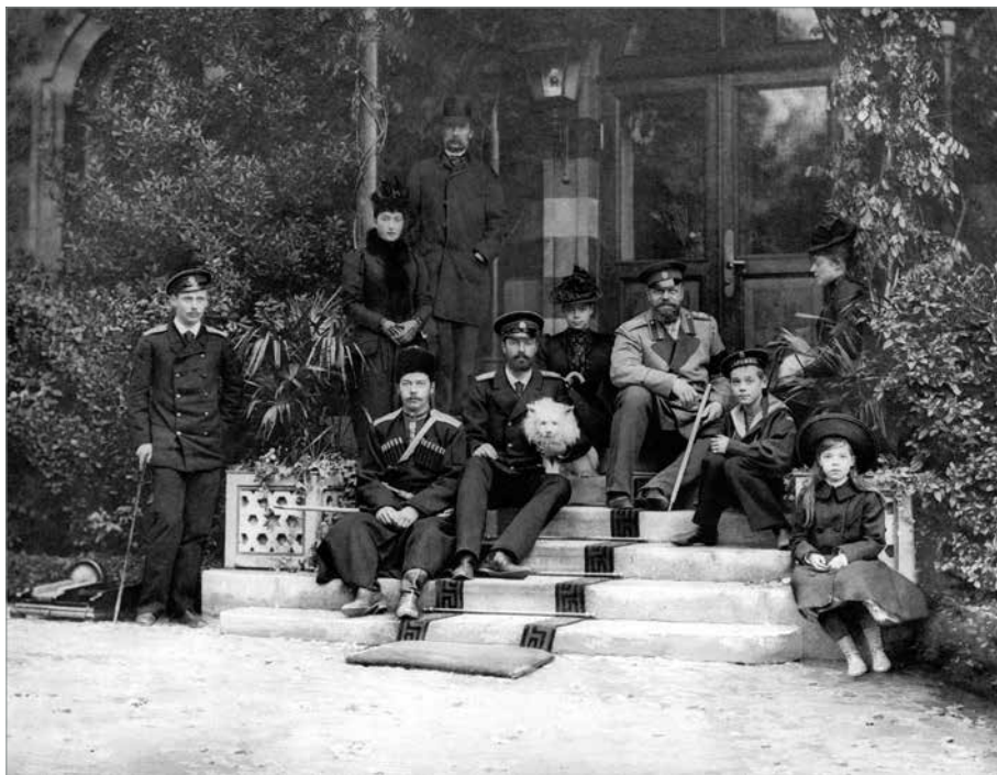
Царская группа в Ливадии в октябре 1891 г. Сидят на ступеньках слева направо: Цесаревич Николай, Великий Князь Александр Михайлович и его жена Великая Княгиня Ксения Александровна. Из альбома «Светописи графа Ностица». 1896 г.

ленных альбомов обладают высокими художественными достоинствами и могут быть интересны специалистам, изучающим историю фотографии.