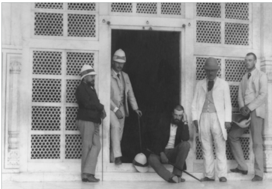
Александр Михайлович (сидит) и Сергей Михайлович (крайний справа) во время путешествия в Индию. Из альбома Великого Князя Сергея Михайловича. 1890–1891 гг.

С историей императорской семьи непосредственно связан и альбом с надписью «Высокой учредительнице в знак беспредельной преданности и благодарности больные офицеры и служащие Благовещенского офицерского отделения усиленного лазарета лейб-гвардии конного полка» 26 . Лазарет носил имя Великой Княгини Александры Иосифовны (1830–1911), младшей дочери герцога Иосифа-Фридриха Саксен-Альтенбургского