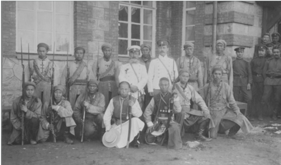
Китайские разведчики на службе в Заамурском округе отдельного корпуса пограничной стражи. Из альбома «В память проезда Е. И. В. Великого Князя Сергея Михайловича через Манчжурию».