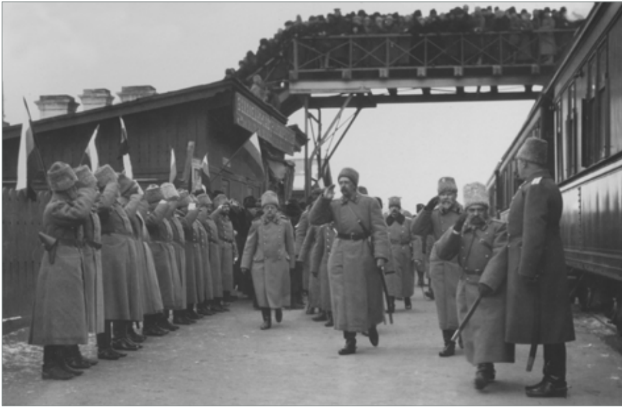
Представление начальствующих лиц Георгию Михайловичу на станции Никольск-Уссурийская.

Из альбома «Е. И. В. Великому Князю Георгию Михайловичу. Китайская и Уссурийская железные дороги». Январь 1916 г.