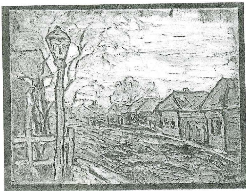
Уфимцев В. И. Осенний пейзаж. Этуд. 1919 г. Холст, масло

1. Пейзаж с избами. Этуд. 1919. К., м. 28,5x22 ОМК - 11494/58